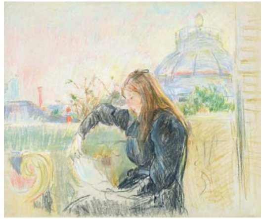
Berthe Morisot. En el balcón , 1893. Pastel sobre papel. 47 x 56 cm. Musée Marmottan Monet, París

Gracias a Fantin-Latour las hermanas Morisot conocieron en 1868 a Édouard Manet, para el que Berthe se convirtió en modelo destacada de varias de sus obras, entre ellas El balcón (1868-69), inspirada en Las majas en el balcón (c. 1808-12) de Francisco de Goya. A partir de entonces mantuvieron una estrecha relación artística y personal, que permitió además a Morisot trabar amistad con un grupo de jóvenes pintores que se inspiraban en la vida diaria y en la frenética actividad urbana para elaborar un nuevo tipo de pintura suelta y libre, muy alejada de las pautas académicas, que poco después, cuando decidieron crear una Sociedad de Artistas invitaron a Morisot a participar en las que serían las exposiciones impresionistas.