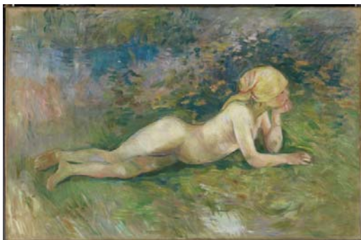
Berthe Morisot. Pastora tumbada , 1891. Óleo sobre lienzo, 63 x 114 cm. Musée Marmottan Monet, París

En 1869 su hermana Edma abandonó la carrera artística tras contraer matrimonio y dejar la casa familiar, por lo que Berthe continuó en solitario su actividad pictórica. Su temática se centra en la pintura de interiores, esos interiores domésticos que abordaron por primera vez los pintores holandeses y que los impresionistas volvieron a recuperar. Un mundo íntimo, en el que encontramos mujeres vestidas con sus vestidos informales, mujeres cosiendo, leyendo, meditando, madres con niños y, excepcionalmente, mujeres en actos públicos, como En el baile , un delicado óleo presentado en la Segunda Exposición impresionista de 1876, en el que una bella dama de la alta sociedad, elegantemente vestida, sostiene un abanico.