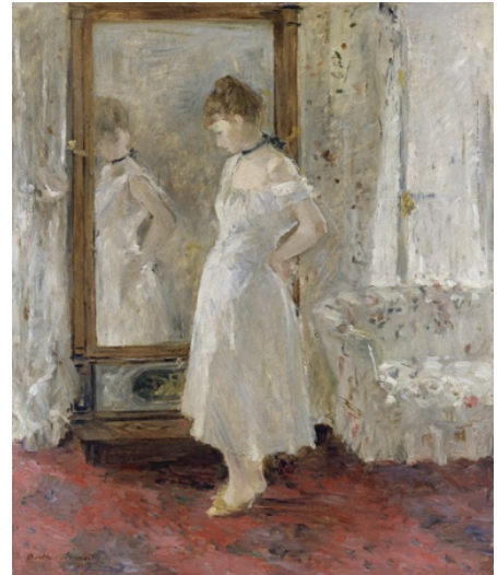
Berthe Morisot. El espejo psíquico , 1876 Óleo sobre lienzo. 65 x 54 cm Museo Thyssen-Bornemisza, Madrid

pinceladas, muestra a una joven vistiéndose pausadamente frente a un espejo de estilo Imperio, espejo que perteneció a la pintora y que ahora se encuentra, entre otros objetos personales, en la colección del Musée Marmottan. La artista estuvo preocupada de manera especial por el estudio de la luminosidad y el color, y compartió el interés de los demás impresionistas por los reflejos de la luz. Su carácter independiente y con cierto punto de rebeldía se deja ver en su obra, que permite acercarse también al papel de la mujer en la Francia de finales del siglo XIX, ya que no sólo fue una gran creadora sino también una mujer burguesa, urbana e interesada por la moda y la activa vida cultural de la época, que se relacionó con intelectuales y artistas como Manet, Renoir, Monet, Pissarro, Degas o Mallarmé. La representación del universo de los sentimientos femeninos fue un asunto tan permanente en la obra de Morisot que su amigo el poeta francés Paul Valéry solía decir de ella que «vivía su pintura» y «pintaba su vida».