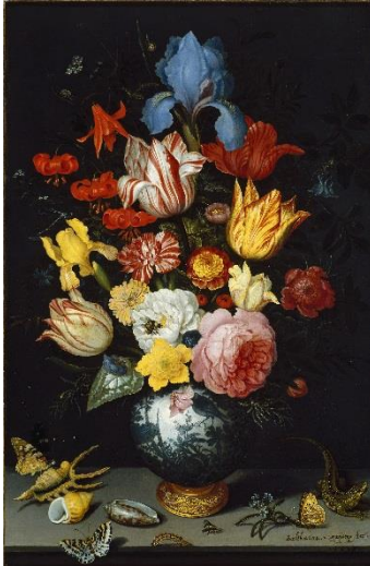
Balthasar van der Ast. Vaso chino con flores, conchas e insectos , 1628. Museo Nacional Thyssen-Bornemisza

El Vaso chino con flores, conchas e insectos , de Balthasar van der Ast, " Les Vessenots " en Auvers, de Vincent van Gogh, y New York City, 3 , de Piet Mondrian, protagonizan también la experiencia de realidad virtual ofrecida estos días en el museo. Utilizando una gafas inmersivas, los participantes pueden adentrarse en estas tres obras de la colección permanente y recorrerlas en un espacio tridimensional.