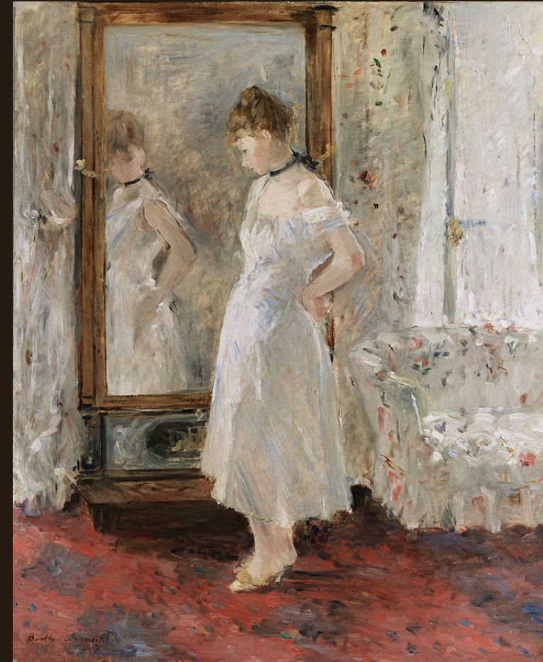
Berthe Morisot El espejo psíquico 1876