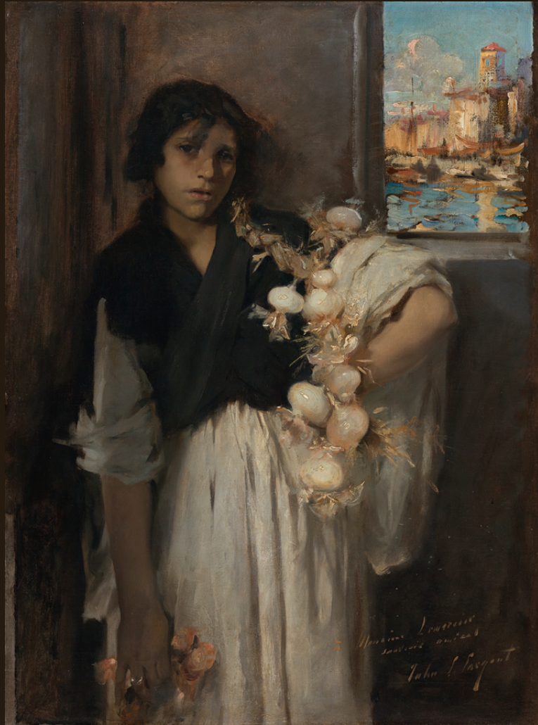
John Singer Sargent Vendedora veneciana de cebollas c. 1880 - 1882