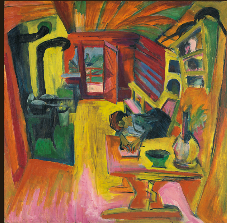
Ernst Ludwig Kirchner Cocina alpina 1918