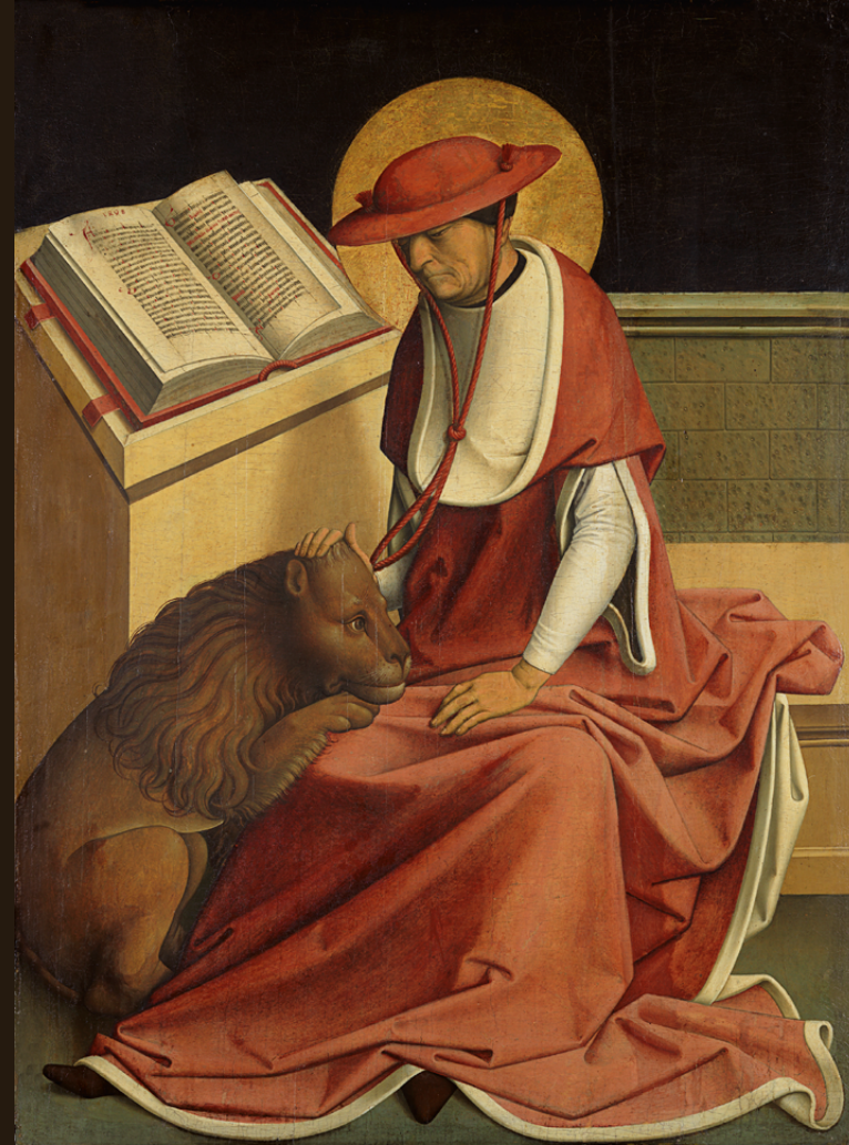
Maestro de Grossgmain San Jerónimo como cardenal 1498