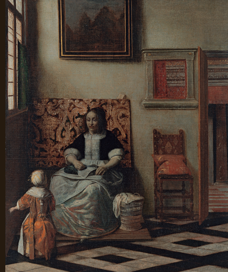
Pieter Hendricksz. de Hooch Interior con una mujer cosiendo y un niño c. 1662 – 1668