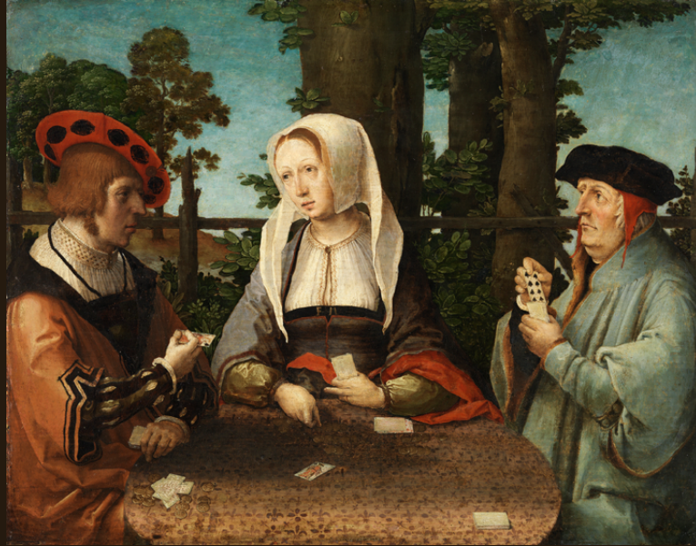
Lucas Hogenbrugg Los jugadores de cartas c. 1520