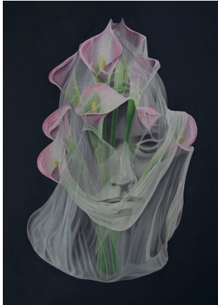
Marina Núñez Cuadro de flores (lirios), 2020 (Flower Painting (lilies)) Óleo sobre lienzo, 112 x 94 cm.