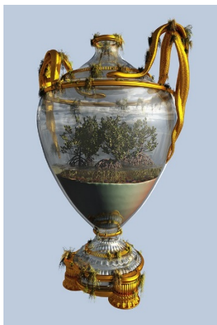
Marina Núñez Naturaleza (manglar) , 2019 ( Nature (Mangrove) ) Vídeo monocal. 2' Modelados 3D: Antonio Fuentes Producido por TEA, Tenerife. Cortesía de la artista y de La Gran