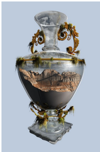
Marina Núñez Naturaleza (montaña) , 2019 ( Nature (Mountain) ) Vídeo monocal. 2' Modelados 3D: Antonio Fuentes Producido por TEA, Tenerife. Cortesía de la artista y de La Gran