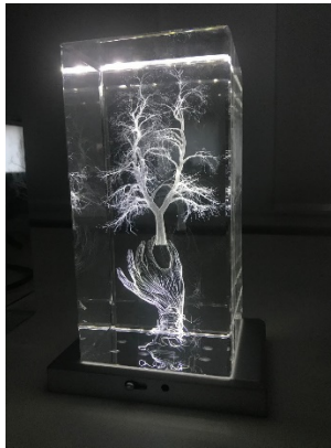
Marina Núñez Retrato (1), 2020. (Portrait (1)) Cristal grabado con láser, base de luz led, 20 x 10 x 10 cm.