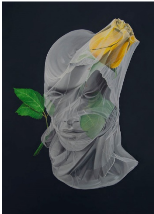
Marina Núñez Cuadro de flores (rosa), 2020 (Flower Painting (rose)) Óleo sobre lienzo, 112 x 94 cm. Cortesía de la artista y de La Gran