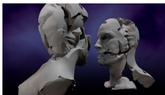
Marina Núñez Vanitas (2) , 2019 ( Vanitas( 2) ) Vídeo monocal, sonido, 1' 22" Música: Luis de la Torre.