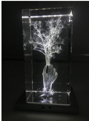
Marina Núñez Retrato (2), 2020. (Portrait (2)) Cristal grabado con láser, base de luz led, 20 x 10 x 10 cm. Cortesía de la artista y de La Gran