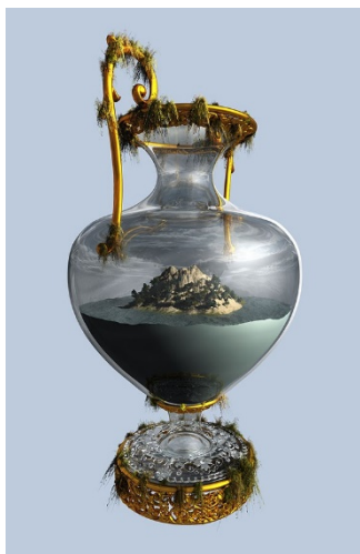
Marina Núñez Naturaleza (isla) , 2019 ( Nature (Island) ) Vídeo monocal. 2' Modelados 3D: Antonio Fuentes Producido por TEA, Tenerife. Cortesía de la artista y de La Gran