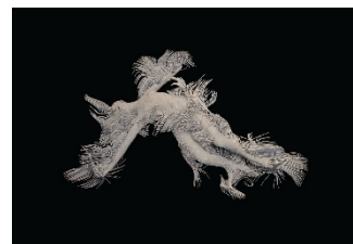
Marina Núñez Marejada (3) , 2020 ( Swell (3) ) Lápiz e impresión sobre madera, 110 x 160 cm.