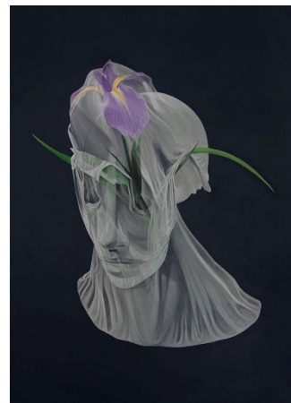
Marina Núñez Cuadro de flores (iris) , 2020 ( Flower Painting (iris) ) Óleo sobre lienzo, 112 x 94 cm. Cortesía de la artista y de La Gran