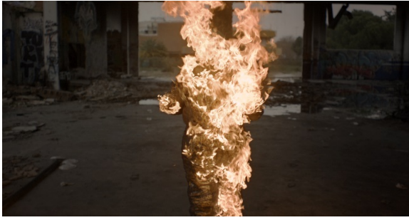
Fotograma de Doble ficción (2021).

este vídeo, las mujeres de Valkiria Stunts, el único equipo femenino de especialistas de riesgo que hay en España, interpretan escenas en las que el doblador había sido un hombre, reivindicando su presencia en la industria cinematográfica.