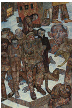
Fig. 7 Pavel Filonov y Alisa Poret Gente pobre, 1927 Vendido en Sotheby's Nueva York el 26 de abril de 2006