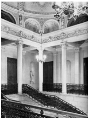
Fig. 2 Escaleras principales del Palacio Shuvalov, sede de La Casa de la Prensa de Leningrado en 1927

general, tratando con gran detalle cada elemento, y aplicando un método científico a la vez que intuitivo. El maestro leía sus manifiestos durante estas sesiones, en las que predicaba la importancia del dominio de la técnica. A su vez invocaba ejemplos tan distintos como los pintores rusos del siglo XIX, Durero y Cranach, o el neoprimitivismo. En la práctica, el resultado son imágenes de una precisión desquiciante, ricas en colores y planos multiplicados, donde el dibujo recorre toda la superficie. Los motivos se encandenan de manera que su aparente fragmentación se articula en un conjunto orgánico. Este carácter orgánico reflejaba para Filónov el continuo crecimiento del mundo y de la obra, que denominaba florecimiento universal.