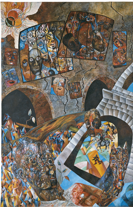
Fig. 1 Tatiana Glebova Prisión , 1927 Museo Thyssen-Bornemisza, Madrid