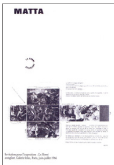
Fig. 8 Invitación a la exposición L'Honni aveuglant , galería lolas, junio-julio 1966, París

del futuro, de lo imprevisto, o de la sorpresa. La tela a vuestra espalda podría ser la memoria, vuestra historia, vuestra cultura, "EL INTERRUPTOR DE LA MEMORIA". El muro de la derecha, EL DÓNDE EN MAREA ALTA, podrían ser las fuerzas que os son hostiles, y el muro de la izquierda, todas las fuerzas aliadas, EL PROSCRITO DESLUMBRANTE. De esta forma, si estuviérais en el centro de percepción de este espacio, tendríais al mismo tiempo una imagen de lo que os puede pasar, de vuestros aliados, vuestros enemigos, de la fuerza de la cultura [...], y al mismo tiempo conciencia del mundo físico en el que os encontráis" 12 .