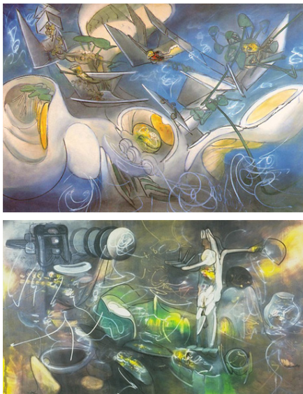
Fig. 9 Matta Le Fond , 1966 Colección privada

L'Honni aveuglant fue, por tanto, una obra clave en la trayectoria de Matta. En primer lugar, como demuestran los textos del artista, supuso un hito en su largo proceso de investigación con el espacio y las dimensiones, tanto físicas como psicológicas. Su concepto de "cubo abierto" no sólo se trasladó al espacio real, con las limitaciones que ello suponía, sino que con este ciclo expresó las máximas aspiraciones de Matta como artista. En el ciclo del Museo Thyssen-Bornemisza el artista realizó un compendio de aquello que ansiaba transmitir a sus contemporáneos en su intento de conseguir elevarlos a un conocimiento superior de la realidad. Pero además se convirtió en un postulado sobre él mismo y su papel como artista en la sociedad.