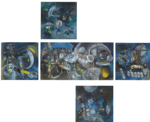
Fig. 6 Matta Être Atout (políptico), 1960 Colección Ramuntcho Matta

Con obras como Être Atout , 1960 (fig. 6), Matta inició ese camino con el que quería llegar a crear una obra de arte total. Algunos años más tarde, en 1965, el Kunstmuseum de Lucerna publicó el postulado