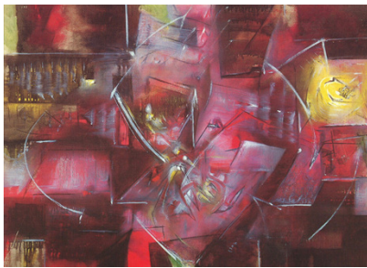
Fig. 5 Matta Le cube ouvert , 1949 Colección privada, París