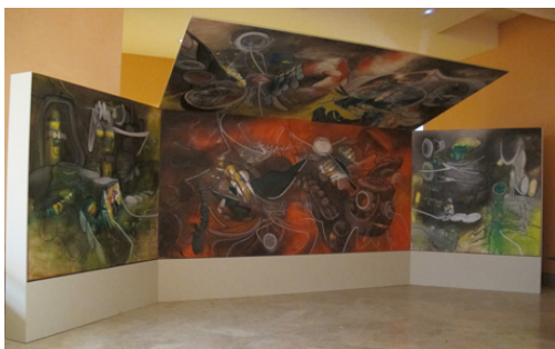
Fig. 4 Instalación temporal de L'Honni aveuglant Museo Thyssen-Bornemisza, septiembre-octubre 2011, Madrid

“La última exposición de Matta en la galería Iolas [de París] ha sido concebida como la ocupación de un espacio a través de la saturación del techo, los muros y el suelo por un conjunto de pinturas” 1 , afirmaba Simone Frigerio en 1966 tras visitar la primera presentación de L'Honni aveuglant al público. “Se trata de un espacio en el que uno penetra como en un baño de vapor tan celeste como infernal” 2 , sentenciaba Geneviève Bonnefoi tras sumergirse en el universo del artista chileno. Testimonios como éstos y los principales estudios del ciclo 3 hacían referencia al singular montaje de las obras del Museo Thyssen poco tiempo después de ser pintadas, pero la falta de documentación gráfica había impedido que se pudiesen volver a mostrar como en aquella primera ocasión (fig. 1).