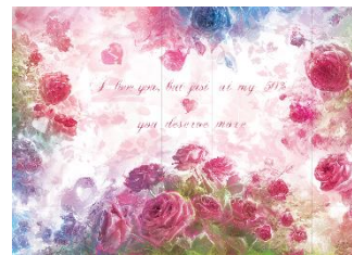
Noemi Iglesias Barrios Bulk Love, 2023 Impresión digital sobre gres porcelánico, 210 x 150 cm Oxidación a 1.000° C Colección de la artista