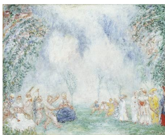
James Ensor Jardin d'amour, hacia 1925 Óleo sobre tabla, 36,8 x 46 cm Colección Carmen Thyssen