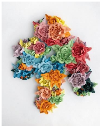
Noemi Iglesias Barrios Hikounia , 2023 Porcelana y pigmentos de colores, 70 x 50 x 20 cm Oxidación a 1.250° C Colección de la artista