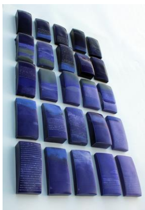
Noemi Iglesias Barrios Landscapes of Affection, 2023 Porcelana, cobalto reciclado de baterías de teléfonos móviles obsoletos y calcas cerámicas, 11 x 8 cm cada pieza Oxidación a 1.250° C Colección ACB, Colección Asun y Fernando y colección privada