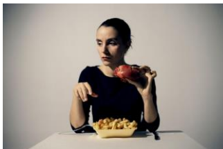
Noemi Iglesias Barrios Heart & Chips, Reino Unido, 2015 Serie de 8 fotografías Impresión fotográfica sobre metacrilato mate, 50 x 30 cm cada una Colección de la artista