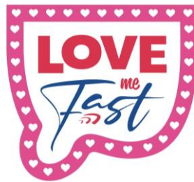
Noemi Iglesias Barrios Love Me Fast, 2023 Caja de metacrilato sobre aluminio lacado y luces LED, 130 x 140 x 15 cm Colección de la artista