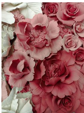
Noemi Iglesias Barrios Love Profusion, 2023 Porcelana y pigmento rojo, 140 x 75 x 15 cm Oxidación a 1.260° C Colección de la artista