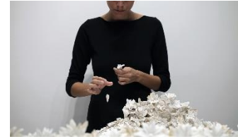
Noemi Iglesias Barrios He Loves Me, He Loves Me Not, 2018 Vídeo HD, 21 min Colección de la artista y Colección Arte Al Límite