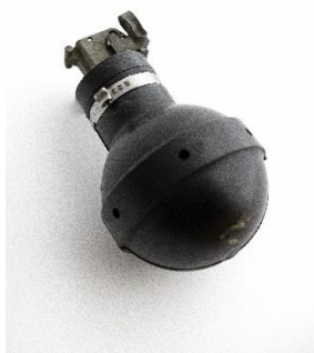
Noemi Iglesias Barrios Dakrigona, Grecia, 2009/2012 Objeto recogido en la huelga general de Atenas en mayo de 2010 Serie de 3. Silicona, 14 x 12 x 12 cm Colección de la artista