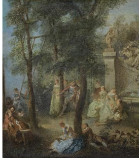
Nicolas Lancret El columpio , hacia 1735-1740 (The Swing) Óleo sobre lienzo, 65,5 x 54,5 cm Museo Nacional Thyssen- Bornemisza, Madrid