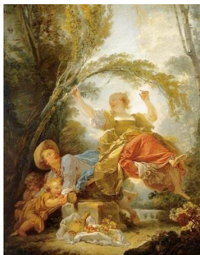
Jean-Honoré Fragonard El columpio , hacia 1750-1752 (The See-Saw) Óleo sobre lienzo, 120 x 94,5 cm Museo Nacional Thyssen- Bornemisza, Madrid