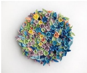
Noemi Iglesias Barrios El columpio II , 2023 Porcelana y pigmentos de colores, 24 x 23 x 4 cm Oxidación a 1.270° C Colección de la artista