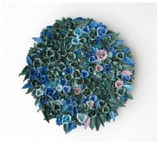
Noemi Iglesias Barrios El columpio III , 2023 Porcelana y pigmentos de colores, 25 x 24 x 4 cm Oxidación a 1.270° C Colección de la artista