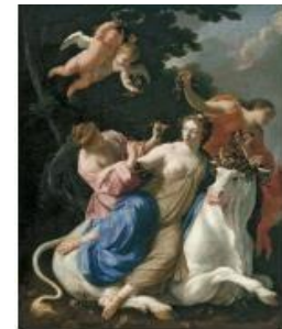
Simon Vouet El rapto de Europa , hacia 1640 (The Rape of Europa) Óleo sobre lienzo, 179 x 141,5 cm Museo Nacional Thyssen- Bornemisza, Madrid