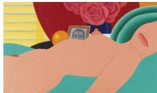
Tom Wesselmann Desnudo n.º 1, 1970 (Nude No. 1) Óleo sobre lienzo, 63,5 x 114,5 cm Museo Nacional Thyssen-Bornemisza, Madrid