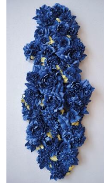
Noemi Iglesias Barrios El mito de Europa , 2023 Porcelana, cobalto y pigmento amarillo, 130 x 60 x 20 cm Oxidación a 1.250° C Colección de la artista