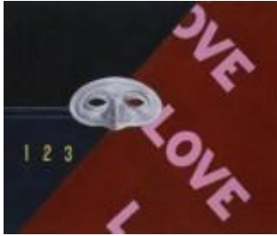
Charles Demuth Love, Love, Love. Homenaje a Gertrude Stein, 1928 (Love, Love, Love. Homage to Gertrude Stein) Óleo sobre tabla, 51 x 53 cm Museo Nacional Thyssen-Bornemisza, Madrid