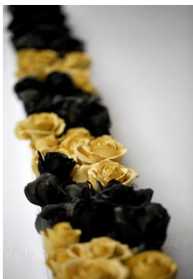
Noemi Iglesias Barrios Isolation , 2019 Porcelana y pigmentos amarillo y negro, 200 x 22 x 21 cm Oxidación a 1.260° C Colección de la artista