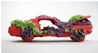
Noemi Iglesias Barrios Everlasting, 2019 Porcelana y pigmentos rojo, verde y violeta, 24 x 17 x 11 cm cada pieza Oxidación a 1.280° C. Serie de 10. Colección de la artista y colección privada