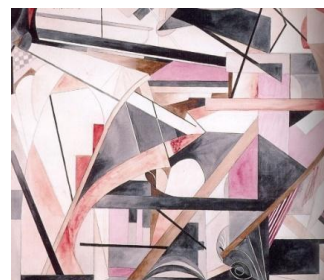
Francis Picabia El apuro, 1914 (Predicament) Acuarela y lápiz sobre papel adherido a cartón, 53,8 x 64,7 cm Museo Nacional Thyssen-Bornemisza, Madrid