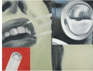
James Rosenquist Vidrio ahumado, 1962 (Smoked Glass) Óleo sobre lienzo, 61 x 81,5 cm Museo Nacional Thyssen-Bornemisza