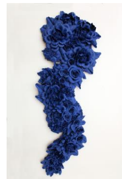
Noemi Iglesias Barrios True Blue , 2023 Porcelana y cobalto, 100 x 50 x 10 cm Oxidación a 1.250° C Colección de la artista