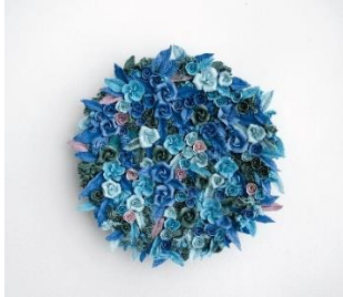
Noemi Iglesias Barrios El columpio I , 2023 Porcelana y pigmentos de colores, 25 x 24 x 4 cm Oxidación a 1.270° C Colección de la artista