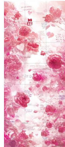
Noemi Iglesias Barrios We Both Swiped Right, 2023 Impresión digital sobre gres porcelánico, 210 x 90 cm Oxidación a 1.000 °C Colección de la artista