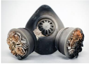
Noemi Iglesias Barrios Quarantine , 2019 Porcelana y soportes metálicos, 230 x 150 x 160 cm. Serie de 40. Cocción de humo en caja refractaria a 1.260° C Cortesía de la artista y Museo de Bellas Artes de Asturias.