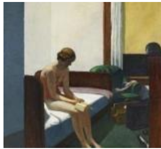
Edward Hopper Habitación de hotel , 1931 (Hotel Room) Óleo sobre lienzo, 152,4 x 165,7 cm Museo Nacional Thyssen-Bornemisza, Madrid