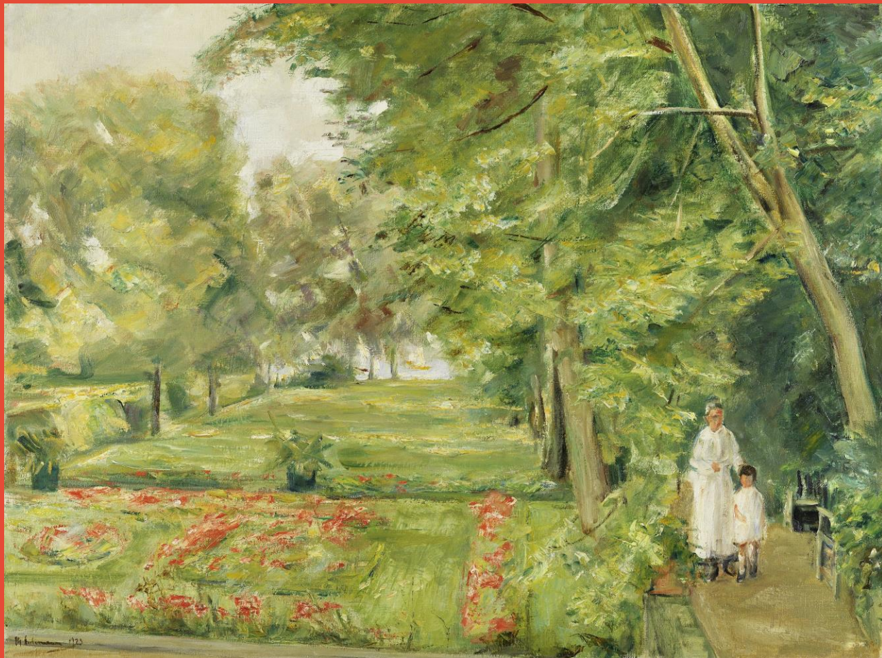
Max Liebermann La nieta del artista con su niñera en el jardín del Wannsee, 1923