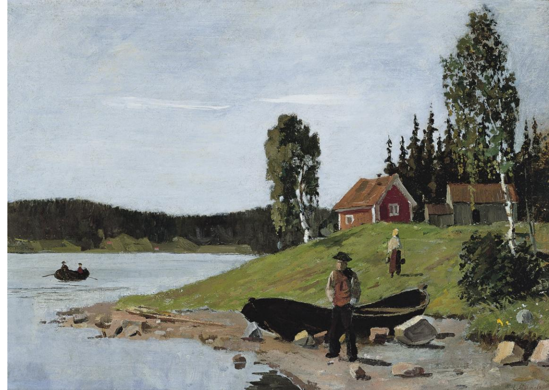
Edvard Munch Ensenada con bote y casa , 1881 Colección Carmen Thyssen

Artistas como Anders Zorn, Ásgrímur Jónsson, Edvard Munch, Johan Christian Dahl, Christen Købke o Hilma af Klint se sirvieron del mundo natural como vía de exploración e investigación, desarrollando lenguajes únicos y profundamente personales.