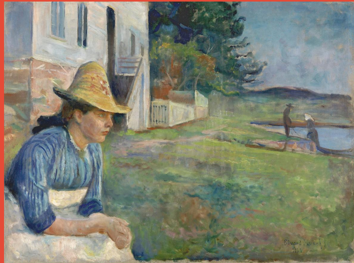
Edvard Munch Atardecer , 1888 Museo Nacional Thyssen-Bornemisza, Madrid