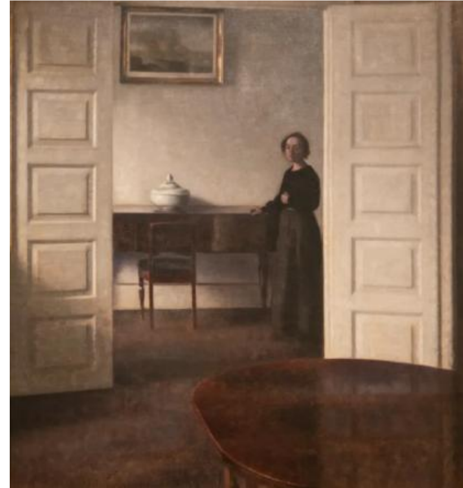
Vilhelm Hammershøi Interior de Bredgade con la mujer del artista, 1911 ARoS, Dinamarca

Vilhelm Hammershøi, Carl Larsson o Helene Schjerfbeck son algunos de los autores que convirtieron la pintura costumbrista y el naturalismo en un nuevo universo cargado de lírica, poética y espiritualidad.