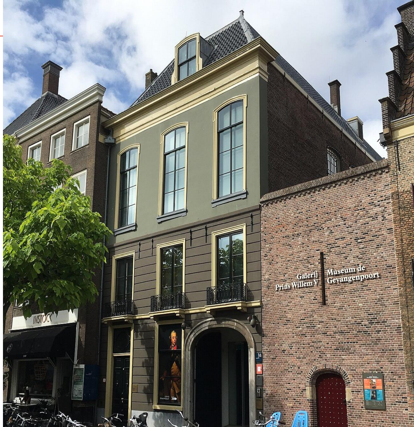
Galería del Príncipe Guillermo V