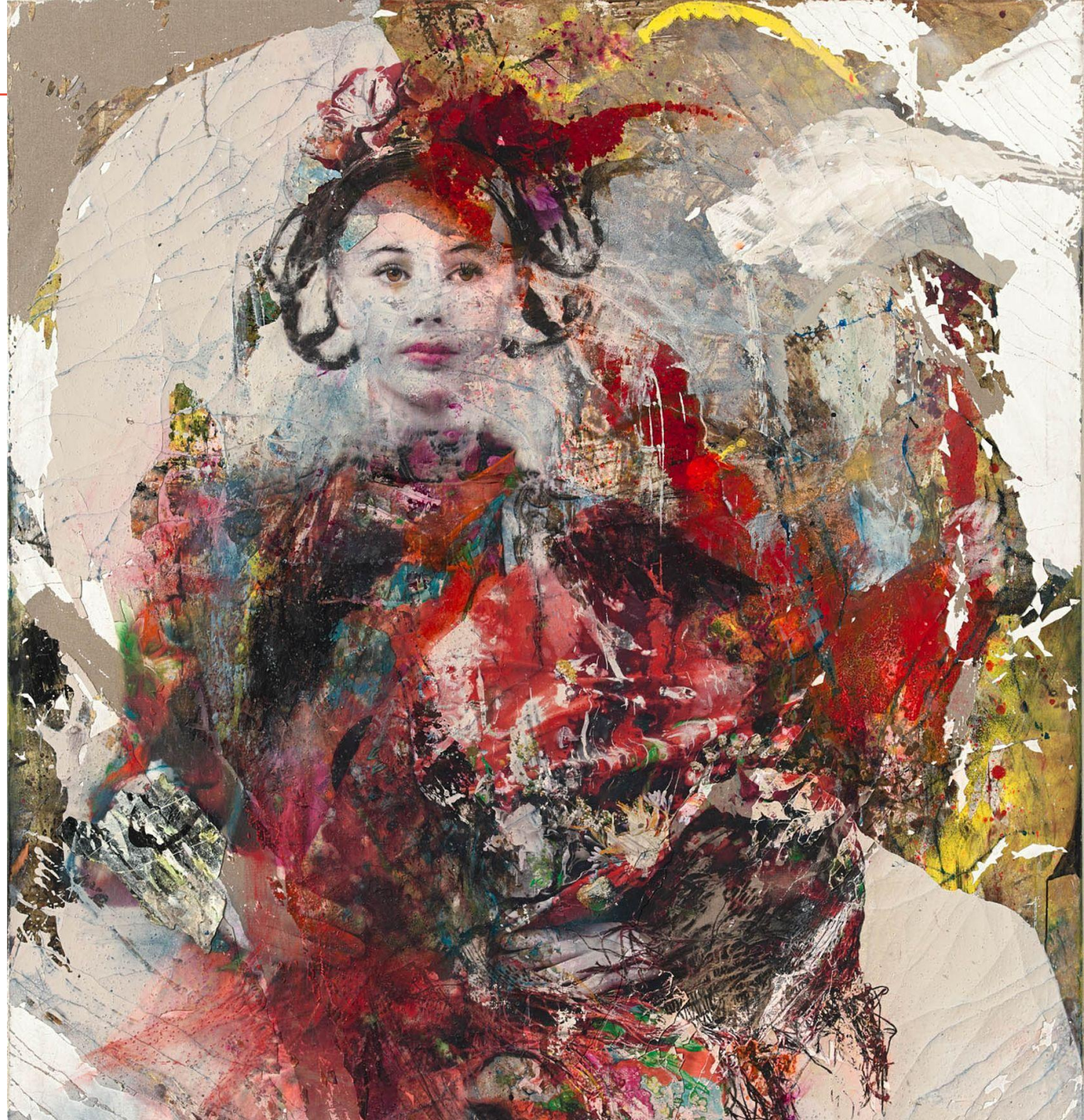
Residencia-estudio de Lita Cabellut