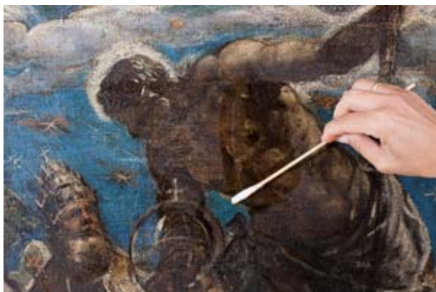
Detalle de la limpieza

preparación oscura, había encajado a pincel un dibujo suelto de color blanco para, posteriormente, aplicar gran cantidad de pintura clara en las zonas con más luz del lienzo, reservando las zonas de sombra.