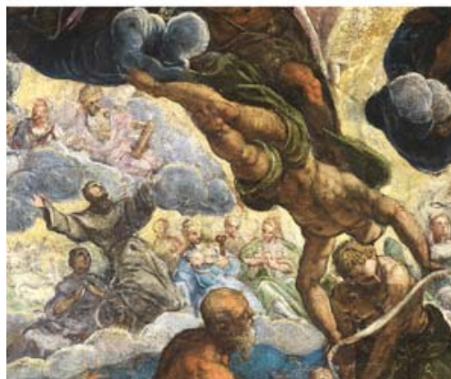
Detalle de la obra y el mismo detalle visto con RX